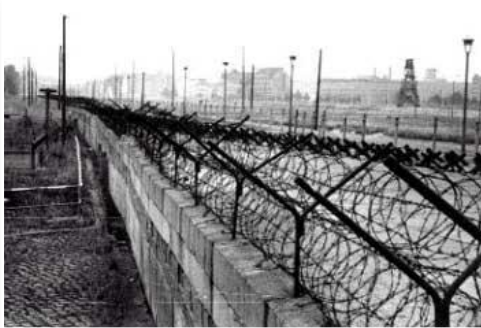
Muro de Berlim (derrubado em 1989)

Disponível em: < http://www.planetaeducacao.com.br/porta/artigo.asp?artigo=186 >. Acesso em 20 jun. 2011.