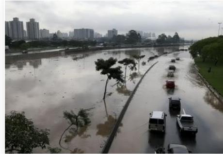
Figura 2 – Rio em área urbana