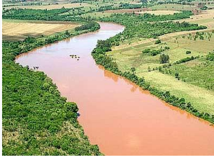
Figura 1 – Rio em área rural

Disponível em: < http://inaa.com.br/ >. Acesso o em 20 jun. 2011.