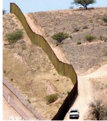
Muro entre EUA e México

Disponível em: < http://www.midia independente.org/pt/blue/2009/12/461822.shtml >. Acesso em 20 jun. 2011.